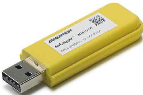
PC通信ユニット(実物大)