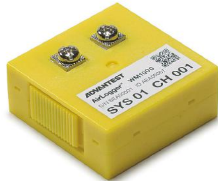
温度測定ユニット(実物大)