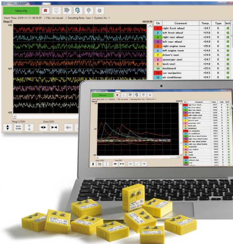
温度プロットソフトウェア