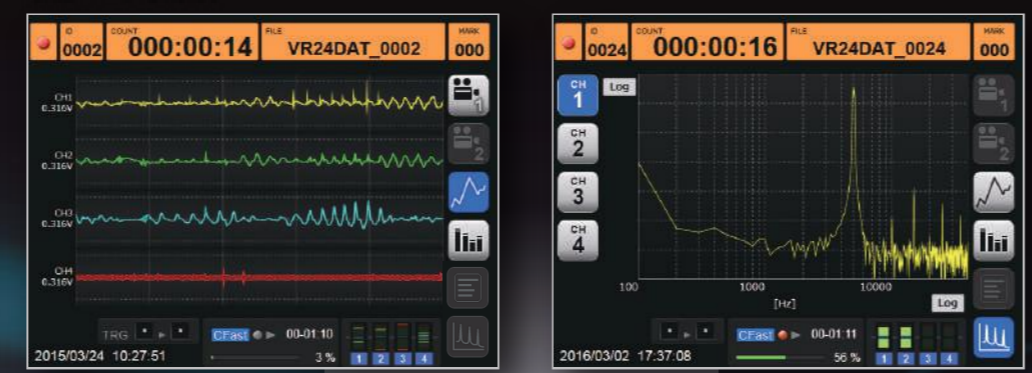
データレベルを波形で表示