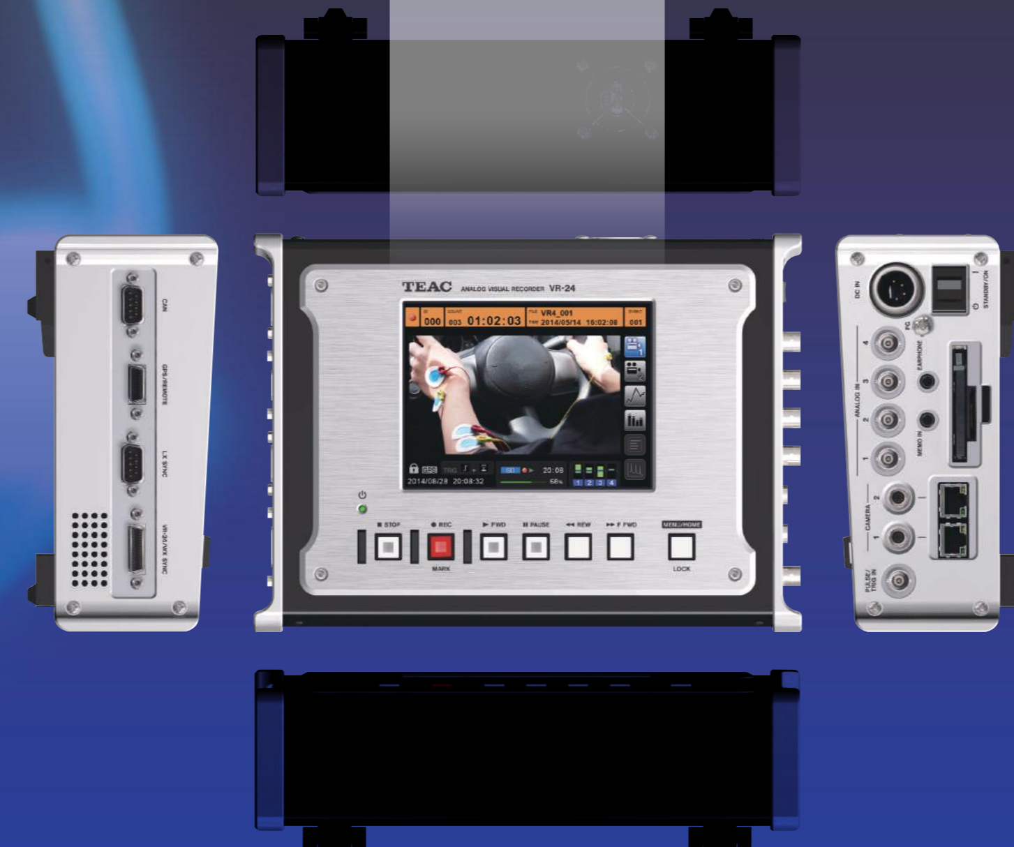
CAN・GPS・パルス表示画面