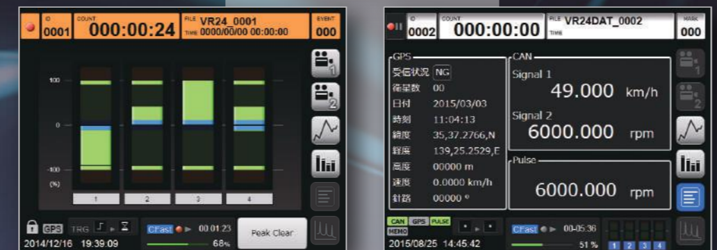
データレベルをバーメーターで表示